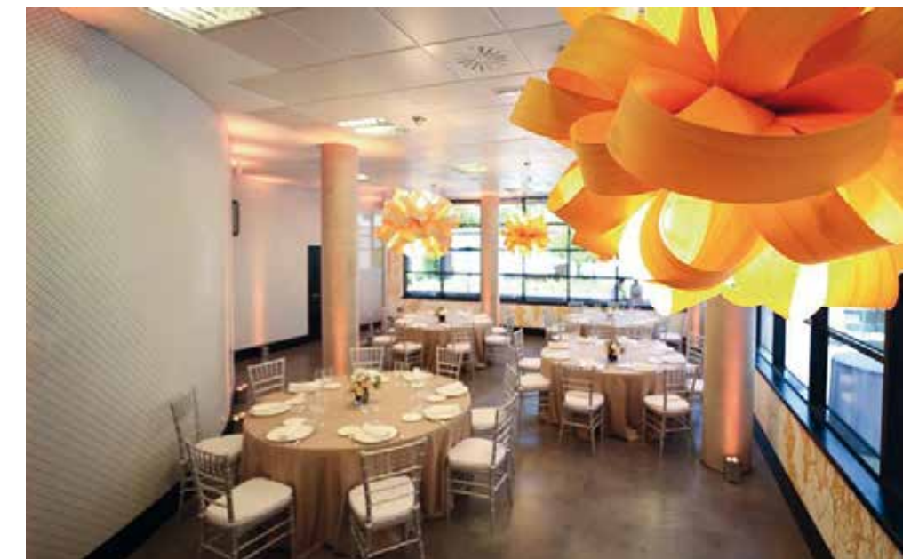
Restaurante del Mindway con pared en curva revestida con mosaico DOPPEL

Me fascinó desde el primer momento. Elegí el modelo blanco con junta gris... ¡Maravilloso!