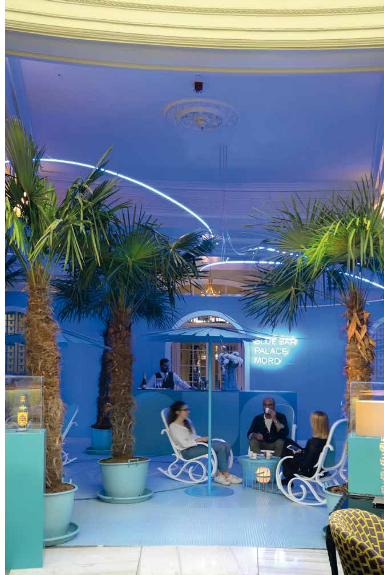
Blue Bar Palace, terraza de verano del Hotel Westin Palace Madrid, creada por Rosa Urbano con un original suelo Art Factory Hisbalit que brilla en la oscuridad. DecorAcción 2018.