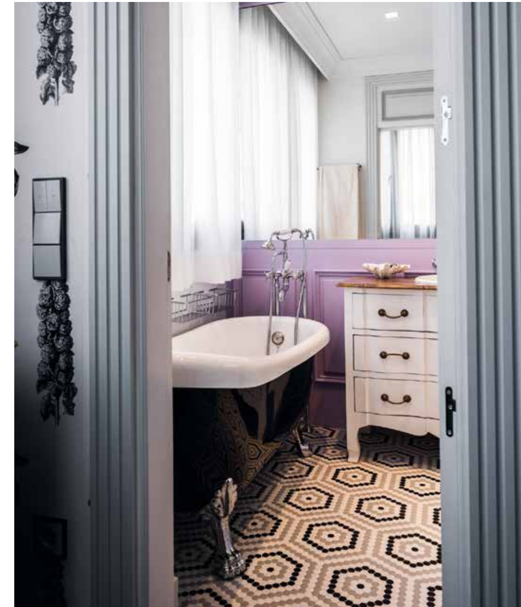
Suelo proyectado por Rosa con el modelo Radial de la colección Art Factory Hisbalit